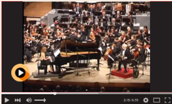
Daniel Binelli - Homage to Tango Concierto Doble para piano, bandoneon y orquesta